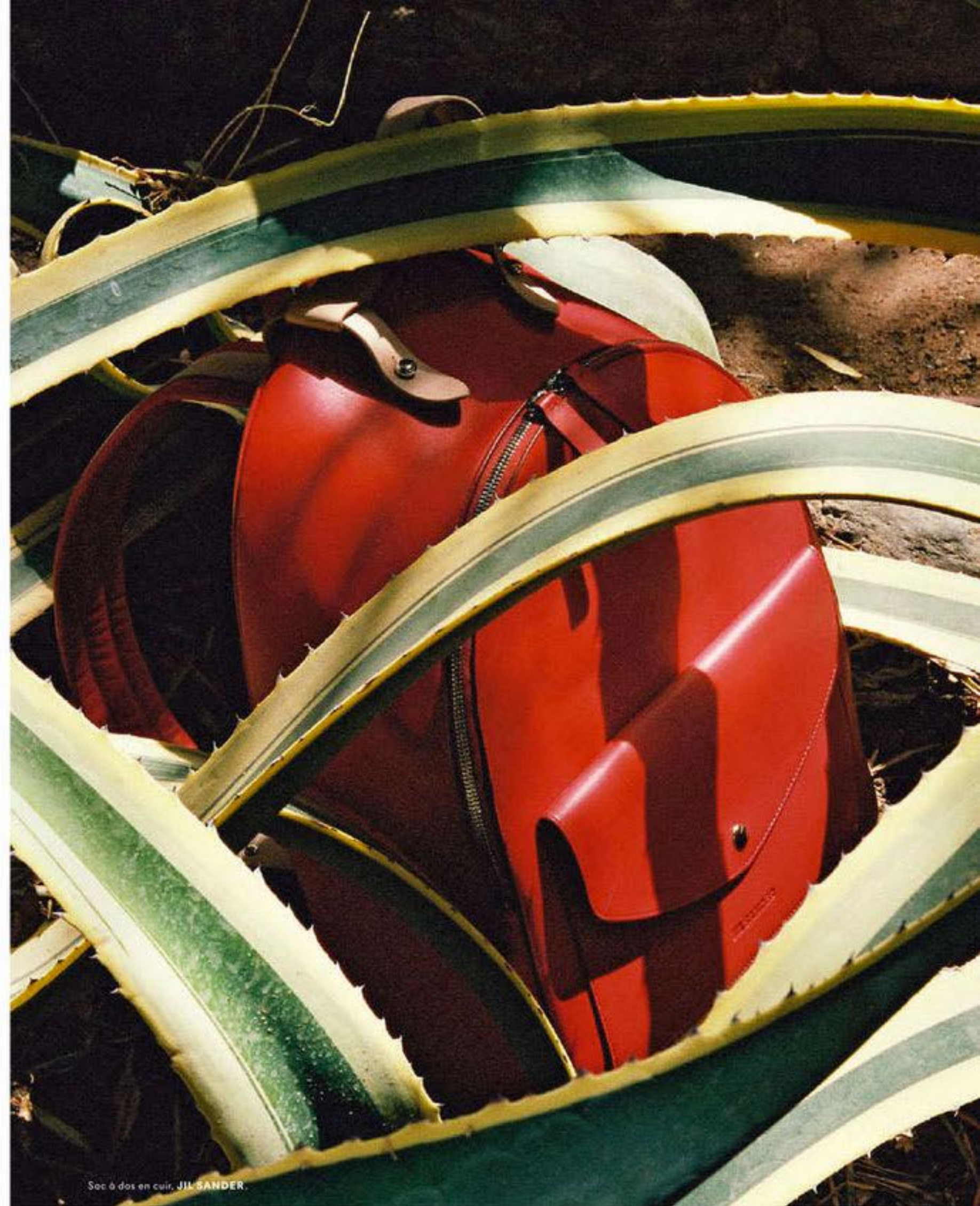
Sac à dos en cuir, JIL SANDER.

Au cœur de la vallée du Drâa, à une heure de Dar Ahlam, au pied de l'Atlas, la vallée des Roses longe sur une soixantaine de kilomètres le plus grand oued du Maroc. D'avril à mi-mai, l'air est saturé des effluves de la rose de Damas. La plus prisée en parfumerie, qui ne pousse qu'ici, au parfum extrêmement concentré et qui se vend 1,50 C l'unité. Partout des distilleries artisanales travaillent les cosmétiques et les huiles essentielles dont la fabrication de quelques gouttes nécessite quatre tonnes de pétales. La première semaine de mai, une grande fête célèbre la Reine des Roses, autrement dit la plus jolie fille berbère. De juin à septembre, ce sont les lauriers roses qui jalonnent le cadre spectaculaire de cette balade au milieu d'un canyon qui semble ne jamais finir. L'expérience Dar Ahlam ? Une heure de marche à travers cet éden et, à l'arrivée, un pique-nique dressé en parfaite harmonie avec le rouge des roches de bauxite.