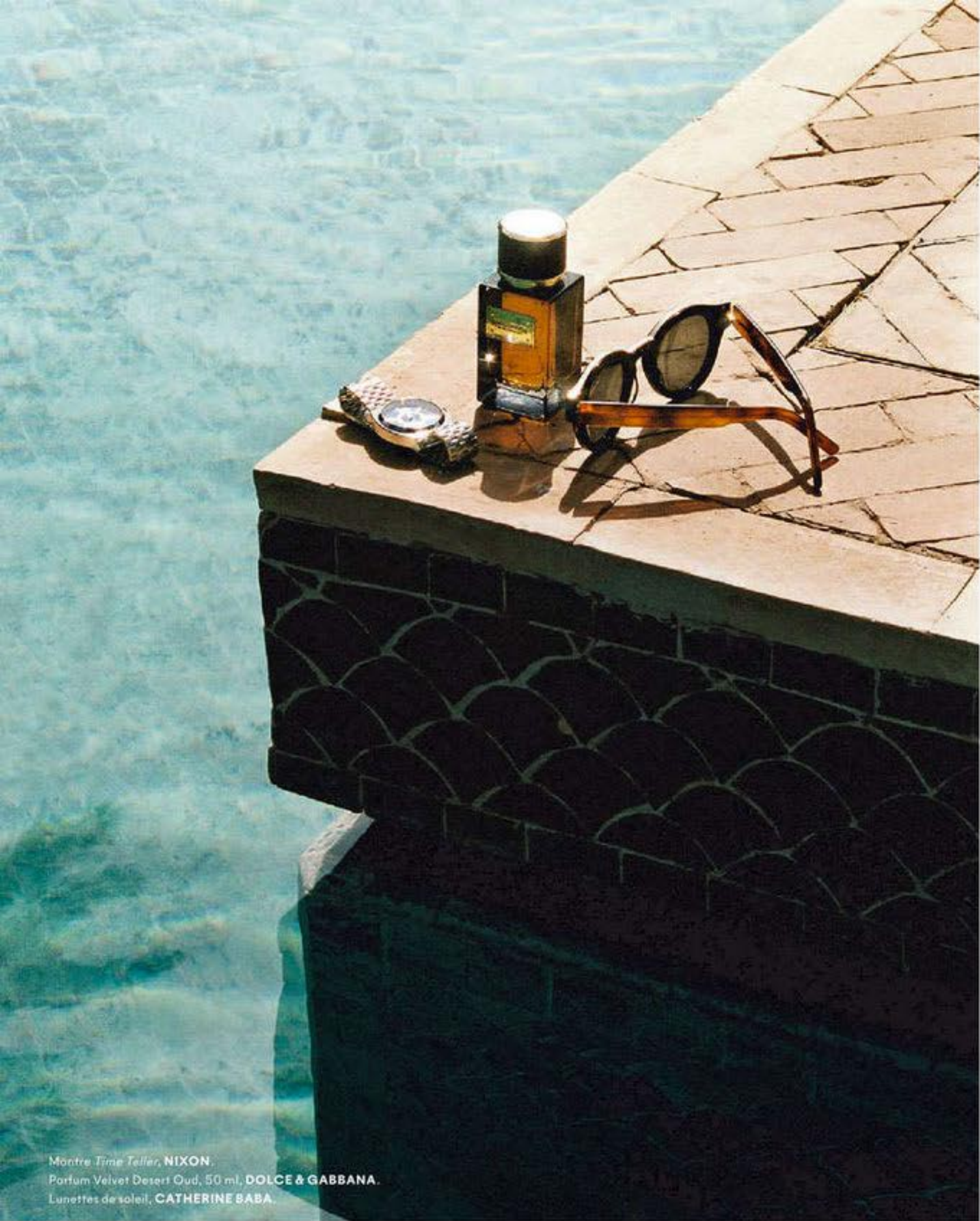
Montre Time Teller, NIXON . Parfum Velvet Desert Oud, 50 ml, DOLCE & GABBANA . Lunettes de soleil, CATHERINE SABA .