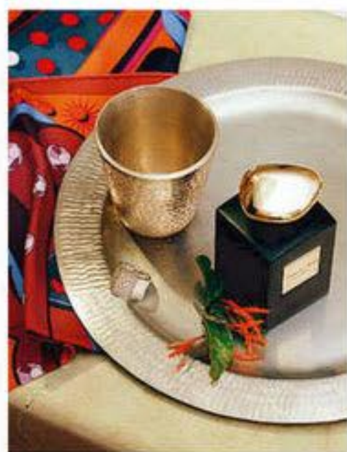
Foulard en soie, HERMÈS. Chevalière en argent, MAISON MARGIELA. Parfum Oud Royal, 100 ml, ARMANI PRIVÉ.