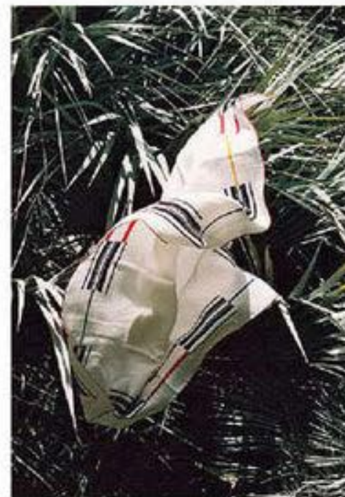
Carré en twill de soie, HERMÈS .