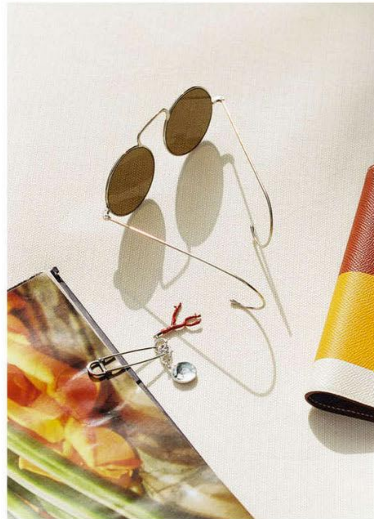
Lunettes, LOEWE . Broche, DIOR HOMME . Portefeuille en cuir, HERMÈS .