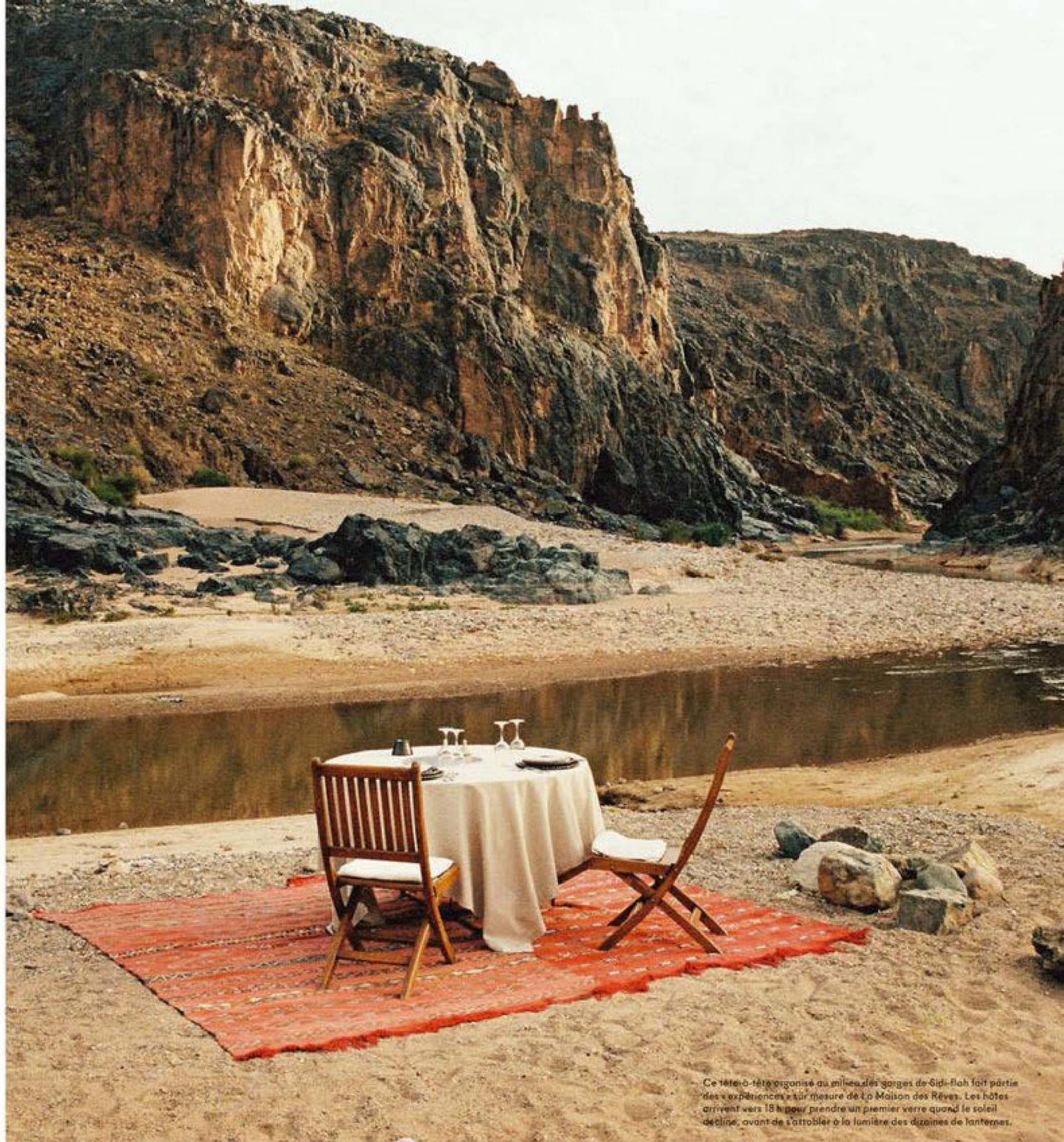
Ce tête-à-tête organisé au milieu des gorges de Sidi-fah fait partie des « expériences » sur mesure de La Maison des Rêves. Les hôtes arrivent vers 18 heures pour prendre un premier verre quand le soleil décline, avant de s'attabler à la lumière des dizaines de lanternes.

C'est l'une des plus grandes du Maroc, étape majeure des caravaniers qui traversaient la vallée du Drâa pour faire commerce de l'or et du sel, puis des pèlerins qui rejoignaient La Mecque. Une vallée que l'on appelle aussi la route des mille casbahs. Skoura et sa palmeraie sont demeurées la résidence de prédilection des Arabes qui ont trouvé ici de quoi survivre - de l'eau et des dattes - pendant leurs périples d'autrefois. Tandis que les Berbères, de grands nomades, ont investi logiquement toute la vallée environnante. Le lundi, jour de souk, tout le monde se retrouve dans cette agora. Si ce souk a une vocation sociale - c'est le point de rencontre entre tous -, il permet d'achalandier les Berbères qui viennent y chercher ce qui leur permet de vivre en autarcie le reste de la semaine.