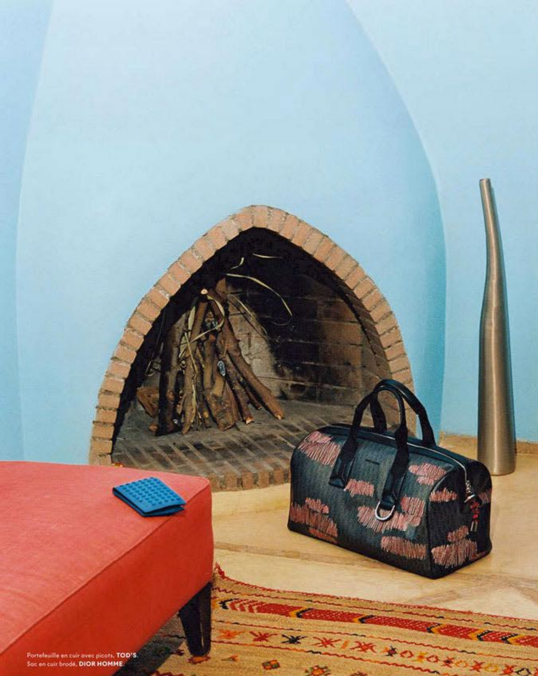
Portefeuille en cuir avec picots, TOD'S . Sac en cuir brodé, DIOR HOMME .