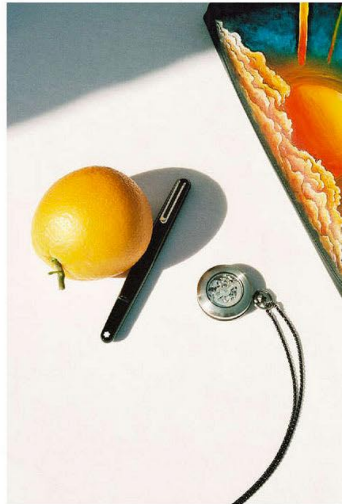
Pochette en cuir peinte à la main, LOEWE . Stylo-plume, MONTBLANC . Montre gousset, FOB PARIS .

L'oasis de Skoura est demeurée très pauvre, vivant essentiellement de l'élevage de biquettes et de moutons, de l'agriculture de la luzerne (destinée à nourrir les bêtes) et du potager. L'eau y est d'autant plus précieuse qu'il n'a pas plu ici depuis janvier 2015. Contraignant ses habitants à creuser toujours plus les puits qui équipent chaque maison. L'architecture des casbahs est ici très particulière. À l'inverse de celle des Marrackchis, dont les zelliges s'inspirent des azulejos de l'Andalousie, elle est rustique, en terre et paille. Là encore, il faut y voir un héritage des Arabes, ces caravaniers qui remontaient du Yémen et du Sahara pour finir leur voyage dans les villes impériales. Les carreaux d'argile au sol conservent la fraîcheur.