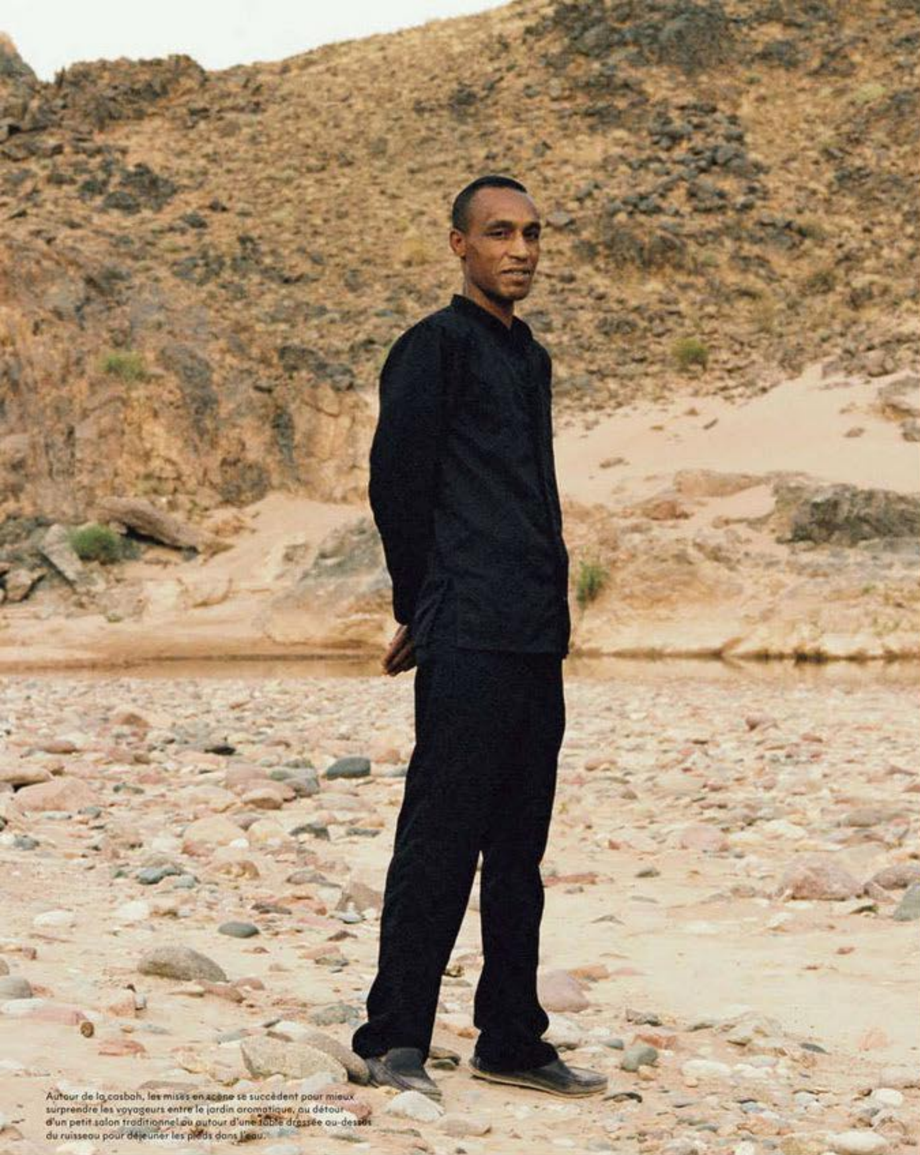
Autour de la casbah, les mises en scène se succèdent pour mieux surprendre les voyageurs entre le jardin aromatique, au détour d'un petit salon traditionnel ou autour d'une table dressée au-dessus du ruisseau pour déjeuner les pieds dans l'eau.