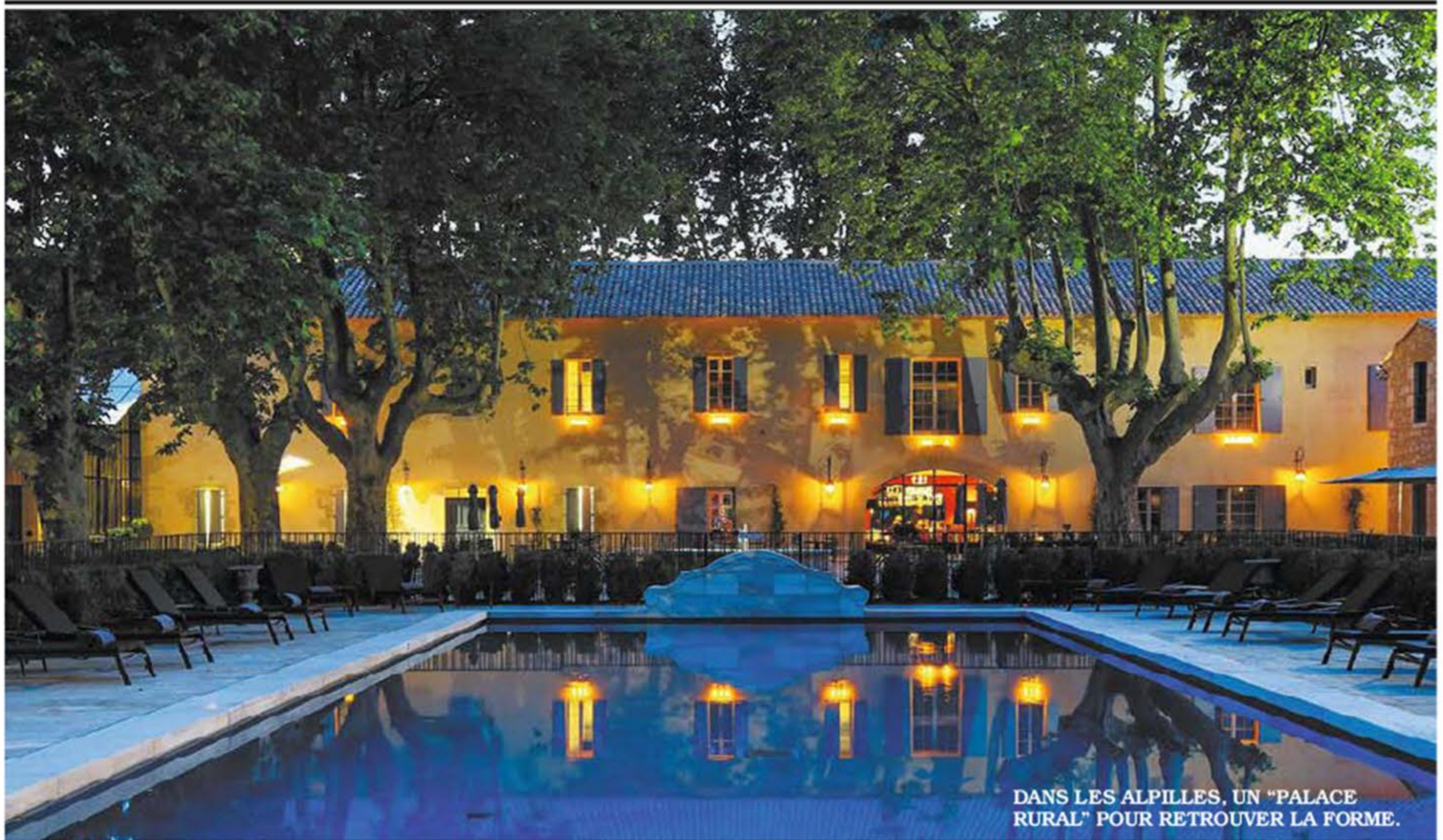
DANS LES ALPILLES, UN "PALACE RURAL" POUR RETROUVER LA FORME.

TROIS JOURS, UNE SEMAINE... JUSTE LE TEMPS DE SE CONSACRER À SOI, ET RIEN QU'À SOI.